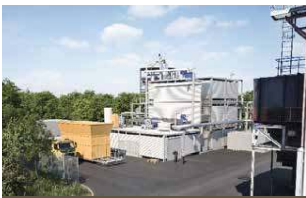
発電出力2,000 kW、発電効率29% 熱出力2,300 kW、ウッドチップ1日64トン

フォレストエナジーは2016年にスウェーデンCortus Energyと提携しました。WoodRoll®は切削ウッドチップを燃料にします。高い精度で温度コントロールされたプロセスにより、極めて高い比率のバークにも対応します。ガス化炉に空気の流入がない間接加熱式のガス化により、生成ガスの約60%が水素と極めて高いこと(窒素で薄まっていない)からFT合成と相性が良く、CO2フリー水素、バイオディーゼル、バイオジェット燃料などのクリーン燃料を木質バイオマスから作る、最先端のガス化技術です。